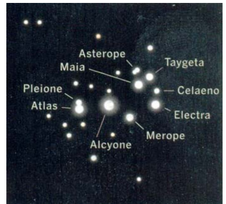
In Japan is die Pleiades bekend as SUBARU. Dit is dan ook die rede vir die sterre op die wapen van die Subaru motors

Many a night I saw the Pleiads Rising thro' the mellow shade, Glitter like a swarm of fireflies Tangled in a silver braid