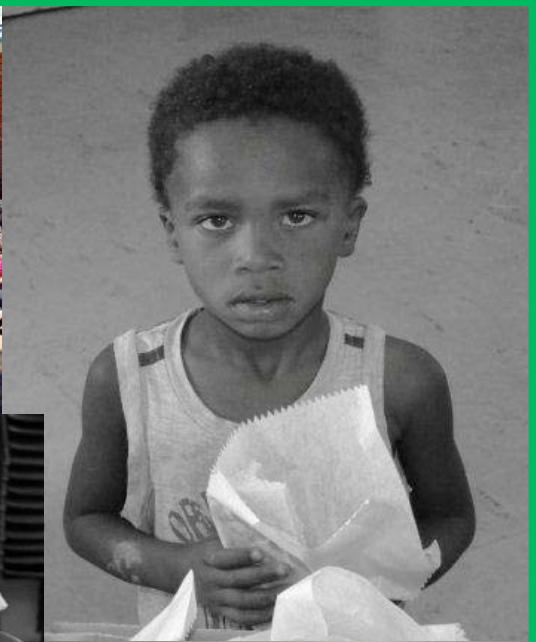
Agape Voedingskema - 2011